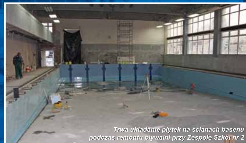
Trwa układanie płytek na ścianach basenu podczas remontu pływalni przy Zespole Szkół nr 2