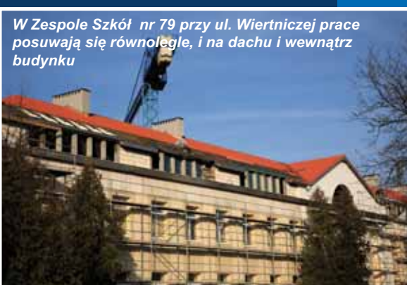
W Zespole Szkół nr 79 przy ul. Wiertniczej prace posuwają się równoległe, i na dachu i wewnątrz budynku

i na parterze • wymiana podłogi w piwnicy oraz ułożenie parkietu dębowego na parterze • wymiana stolarki okien z drewnianej na PCV • wymiana szaf wnękowych w klasach • remont sali gimnastycznej. Termin wykonania: październik - grudzień 2008 koszt - 610 231 PLN