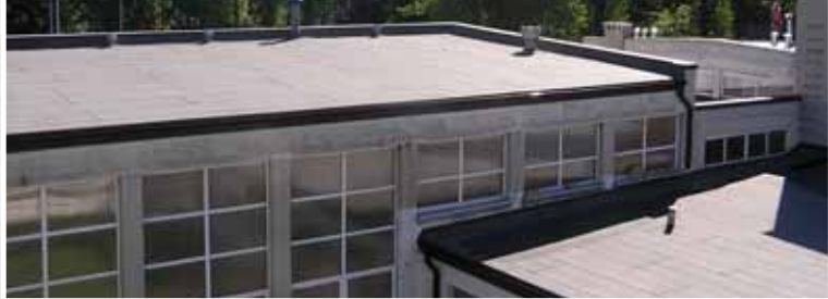
Wyremontowane dachy w Zespole Szkolno-Przedszkolnym nr 3 w Powsinie.