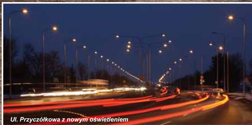
Ul. Przyczółkowa z nowym oświetleniem