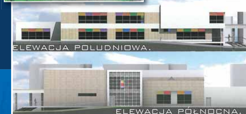
ELEWACJA POLUDNIOWA. ELEWACJA PÓLNOCNA.