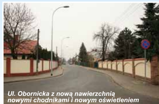
Ul. Obornicka z nową nawierzchnią, nowymi chodnikami i nowym oświetleniem