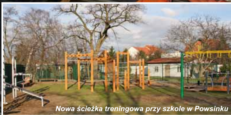
Nowa ścieżka treningowa przy szkole w Powsinku

Wykonano także dokumentację techniczną dla remontu sal gimnastycznych w Szkole Podstawowej nr 104 przy ul. Przyczółkowej oraz w Szkole Podstawowej nr 169 przy ul. Uprawnej. Przeprowadzenie remontów jest planowane na najbliższe lata.