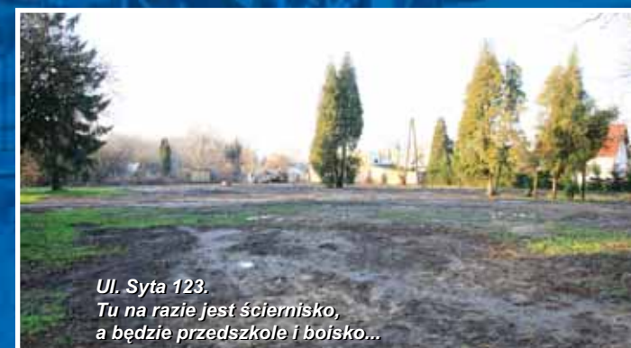
Ul. Syta 123. Tu na razie jest ściernisko, a będzie przedszkole i boisko...