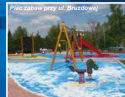
Plac zabaw przy ul. Bruzdowej