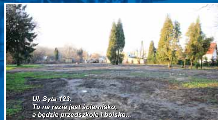
Ul. Syta 123. Tu na razie jest ściernisko, a będzie przedszkole i boisko...