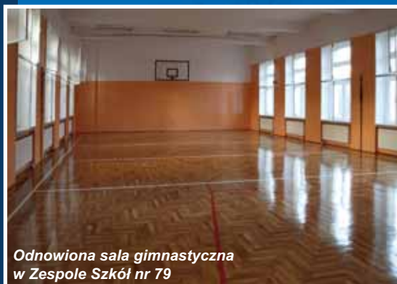
Odnowiona sala gimnastyczna w Zespole Szkół nr 79

W 2008 r. wykonano także projekt adaptacji pomieszczeń mieszkalnych w budynku Zespołu Szkół nr 79, dzięki temu możliwe będzie wygospodarowanie dodatkowych sal na potrzeby szkoły, w tym dla przyszłej zerówki, pomieszczeń dla harcerzy i redakcji gazetki szkolnej. Koszt projektu - 50 630 PLN.