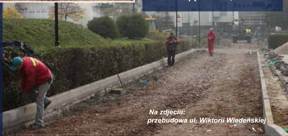
Na zdjęciu: przebudowa ul. Wiktorii Wiedeńskiej

Dwupasmową trasę wylotową z Warszawy w kierunku Konstancina wybudowano w latach 70. Dopiero w tym roku, po ponad 30 latach doczekała się odpowiedniego oświetlenia.