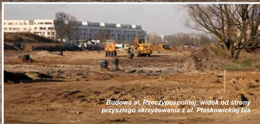
Budowa al. Rzeczypospolitej; widok od strony przyszłego skrzyżowania z ul. Płaskowickiej bis