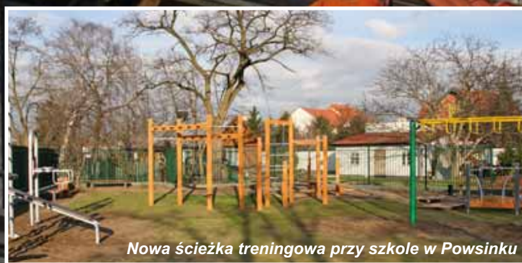
Nowa ścieżka treningowa przy szkole w Powsinku

Wykonano także dokumentację techniczną dla remontu sal gimnastycznych w Szkole Podstawowej nr 104 przy ul. Przyczółkowej oraz w Szkole Podstawowej nr 169 przy ul. Uprawnej. Przeprowadzenie remontów jest planowane na najbliższe lata.