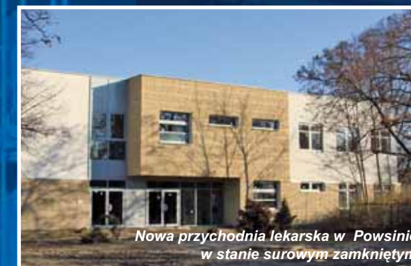
Nowa przychodnia lekarska w Powsinie w stanie surowym zamkniętym

Zakupiono pierwsze wyposażenie dla placówek zlokalizowanych w nowym budynku: komputery, meble, książki i instrumentów muzycznych.