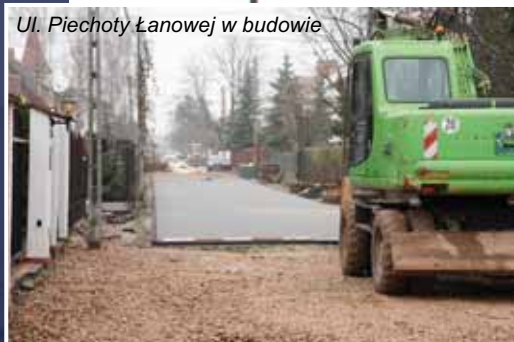
Ul. Piechoty Łanowej w budowie

Zakres prac: wymiana istniejącej nawierzchni na nawierzchnię z kostki brukowej betonowej, wykonanie odwodnienia ulicy oraz wprowadzenie organizacji ruchu, obejmującej m.in. wykonanie progów zwalniających. Koszt inwestycji - 1 270 524,32 PLN