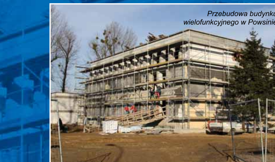
Przebudowa budynku wielofunkcyjnego w Powsinie