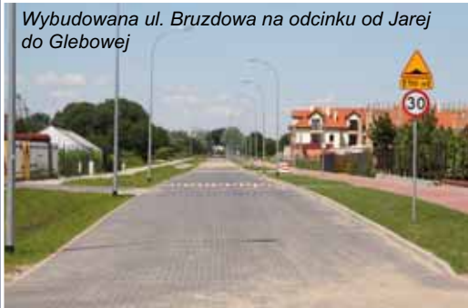
Wybudowana ul. Bruzdowa na odcinku od Jarej do Glebowej

Zakres wykonanych prac: budowa jezdni o szerokości 6 m, zatok postojowych, chodnika, ciągu pieszorowerowego, zjazdów, odwodnienia powierzchniowego, oświetlenia ulicznego, wprowadzenie stałej organizacji ruchu. Całość nawierzchni wykonana została z kostki brukowej betonowej z progami zwalniającymi. Koszt inwestycji - 1 830 874,39 PLN