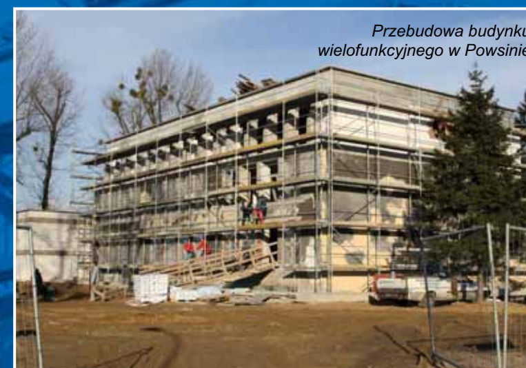
Przebudowa budynku wielofunkcyjnego w Powsinie